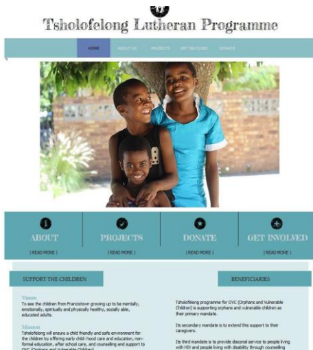
Kuva 6. Toivon Paikan- www-sivut

Nettisivuhankkeemme on edistynyt taas hiukan eteenpäin ja mahdollisesti pääsemme kesällä julkaisemaan useimmat näistä. Alla teille esimakua sivustojen ulkoasusta: