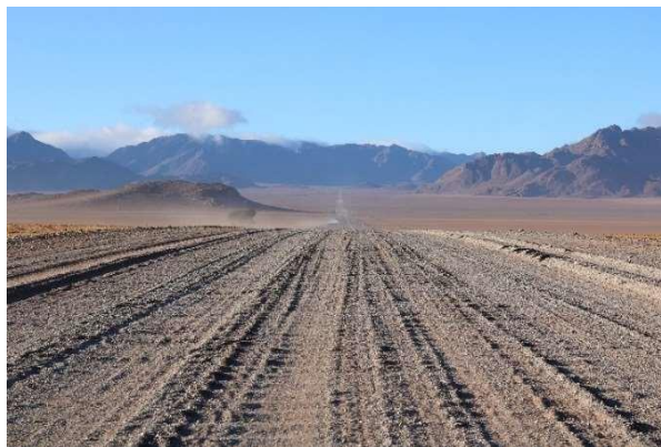
Kuva 1. Namibian hiekkatiet ovat pitkiä ja pomppuisia