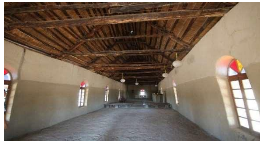
Kuva 3. Olukondan ensimmäinen kirkko

Työntekijäpäivän jälkeen ajoimme Angolaan Lubangon kaupunkiin kollegamme pyynnöstä Angolassa tutustuaksemme Angolan yhteistyökumppanin ISTEEL – teologisen seminaarikeskuksen talousasioihin ja selvittäen taloustoimiston tilanteen. Viime vuonna vierailimme myös Lubangossa tutustumassa ja konsultoimassa Angolan evankelisluterilainen kirkon (IELA) taloustoimistoa. Myös tällä matkalla kävimme IELA:n taloustoimistossa katsomassa kuinka he ovat edistyneet talousasioiden kehittämisessä. Kävimme tutustumassa uudestaan Tundavalan torkoon, jonka reunan korkeus ylittää 2200 m, kun taas alapuolella oleva taso on noin 1200 m alempi, mikä luo melko vaikuttavan näkymän, joka kattaa kymmenien kilometrien etäisyyden.