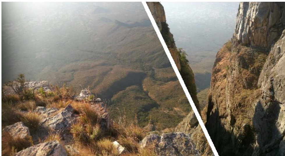
Kuva 4. Tundavalan rotko

Työntekijäpäivän jälkeen ajoimme Angolaan Lubangon kaupunkiin kollegamme pyynnöstä Angolassa tutustuaksemme Angolan yhteistyökumppanin ISTEEL – teologisen seminaarikeskuksen talousasioihin ja selvittäen taloustoimiston tilanteen. Viime vuonna vierailimme myös Lubangossa tutustumassa ja konsultoimassa Angolan evankelisluterilainen kirkon (IELA) taloustoimistoa. Myös tällä matkalla kävimme IELA:n taloustoimistossa katsomassa kuinka he ovat edistyneet talousasioiden kehittämisessä. Kävimme tutustumassa uudestaan Tundavalan torkoon, jonka reunan korkeus ylittää 2200 m, kun taas alapuolella oleva taso on noin 1200 m alempi, mikä luo melko vaikuttavan näkymän, joka kattaa kymmenien kilometrien etäisyyden.