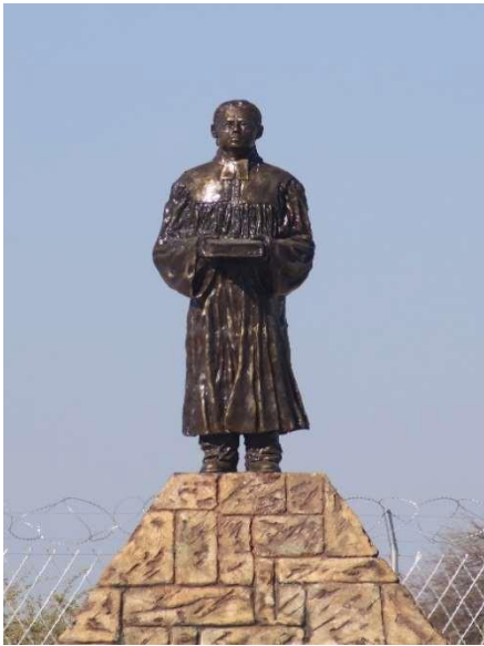
Kuva 2. Martti Rautasen patsas Namibiassa

Eteläisen Afrikan työntekijät viettivät työntekijäpäiviä Namibiassa Oniipassa ja Etoshassa helmikuun puolessa välissä. Kokoustamisen lisäksi tutustuimme paikkoihin, jonne ensimmäiset lähetyssaarnaajat saapuivat vuonna 1870.