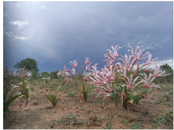
Botswanan luonnosta löytyy Nerine Laticoma.