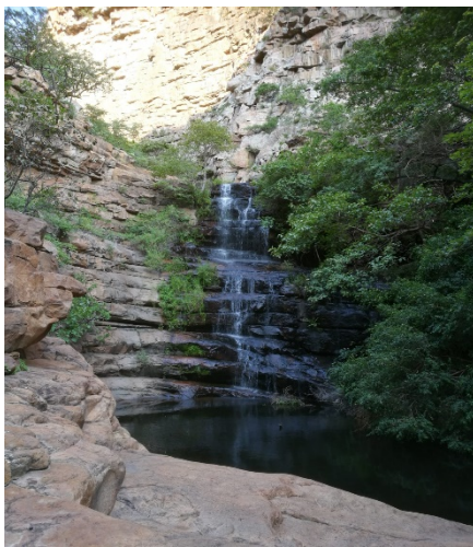
Vesiputous - Moremi Gorge

Uuden vuoden tulo on näkynyt voimakkaimmin kuntosalilla, jonka parkkipaikka täyttyy autoista ennen aamuviittä, kun ylimääräistä fyysistä auktoriteettia yritetään karistaa lanteilta. Kirjakaupassa huomaa myös kuinka erilaiset elämänhallintaoppaat ym. tekivät hyvin kaupansa kauppojen auettua uuden vuoden vapaiden jälkeen.