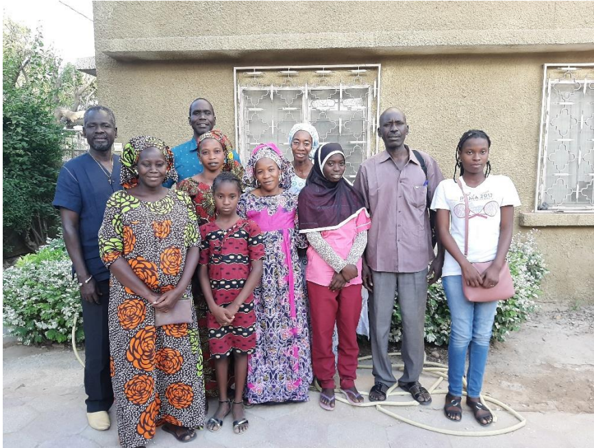
Kuva 2 Saint-Louis'n seurakunnan työntekijöitä yhdessä kummiohjelmassa mukana olevien perheiden kanssa.

Saint-Louis'n antoisan päivän jälkeen suuntasimme edelleen kohti pohjoista, seuraavaksi Ndioumiin. Ndioum sijaitsee aivan Mauritanian rajalla, ja tunnetaan kuumuudestaan. Ndioumiin matkatessamme teiden varsilla komeili riisiviljelmiä, aurinkopaneelipeltoja ja tuulen kuljettamia hiekkadyynejä. Kuumuuden keskellä muistin, kuinka tosiaan olemme Sahelin yöhykkeellä.