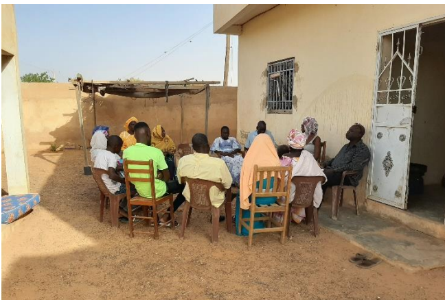
Kuva 4. Kokoontuminen Ndioumissa.

Ndioumissa kokoontuimme yhdessä ulos kirkon rakennuksen luoman varjon alle. Keskustelimme pitkään vapaamuotoisesti nuorten kanssa, ja heillä oli paljon tärkeitä ja ajankohtaisia näkemyksiä Senegalista. Osalle tärkeää olisi saada nähdä enemmän äidinkielistä opetusta julkisella sektorilla. Tutkimuksetkin tähän rohkaisevat, ja Senegalin valtio yhdessä monien järjestöjen, mukaan lukien Suomen Lähetysseuran, kanssa tätä työtä edistää. Lisäksi nuorten toiveissa oli saada nähdä entistä itsenäisempi Senegal, jossa uudet sukupolvet aktiivisesti kehittäisivät maataan kestäväan suuntaan. Vanhemmat ja nuoret lähettivät paljon terveisiä kummeille, ja halusivat painottaa, kuinka suuri apu kummityön tuki heille on!