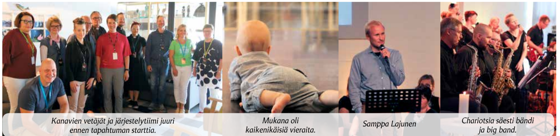
Kanavien vetäjät ja järjestelytiimi juuri ennen tapahtuman starttia.

”RIEMUn järjestelyt onnistuivat hyvin ja järjestäjätillä oli suorastaan kivaa: Me oltiin riemulla töissä. Iloitsin paikallisista voimista ja tekemisen asenteesta. Kanavan pitäjät, vastuunkantajat eri seurakunnista jne. tekivät hienoa työtä. Chariots oli huikea ja Sampan puhe kosketti monia. Ihmisiä oli hyvin liikkeellä ja loppuillasta jouduttiin jopa kantamaan lisätuoleja helluntaiseurakunnan aulaan. Lastenohjelman puuttumisesta saimme palautetta, mutta tämä muistetaan jatkossa. Tästä on hyvä jatkaa!”