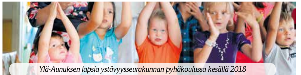
Ylä-Aunuksen lapsia ystävyysseurakunnan pyhäkoulussa kesällä 2018