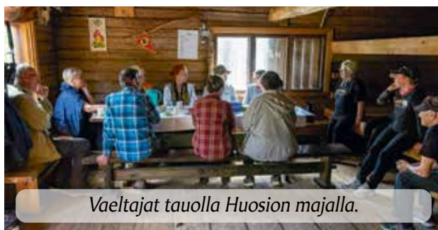
Vaeltajat tauolla Huosion majalla.