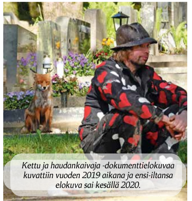
Kettu ja haudankaivaja -dokumenttielokuvaa kuvattiin vuoden 2019 aikana ja ensi-iltansa elokuva sai kesällä 2020.

Kettu ja haudankaivaja Alfa TV:llä ke 7.4 klo 17, to 8.4. klo 00.00 (kaapeli-tv), pe 9.4 klo 15, la 10.4 klo 10, pe 30.4 klo 21 ja ma 3.5 klo 13