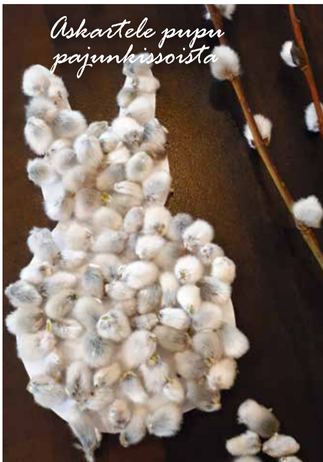
Askartele pupu pajunkissoista