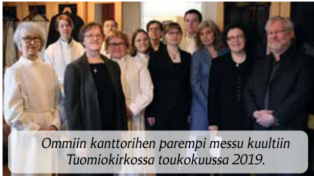
Ommiin kanttorihin parempi messu kuultiin Tuomiokirkossa toukokuussa 2019.