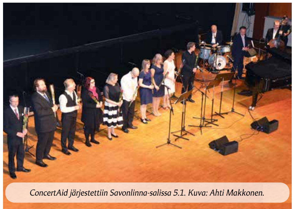
ConcertAid järjestettiin Savonlinna-salissa 5.1.