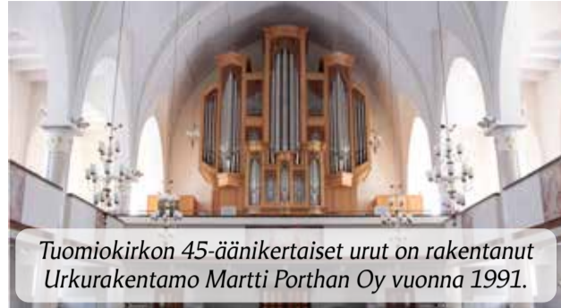
Tuomiokirkon 45-äänikertaiset urut on rakentanut Urkurakentamo Martti Porthan Oy vuonna 1991.