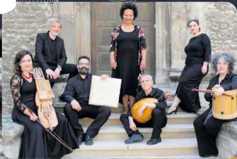
Italialainen Ensemble Lucidarium & muut Kirkkomusiikkiviikon tähtihetket s. 3

Savonlinnan Kirkkomusiikkiviikko 27.10.-3.11.