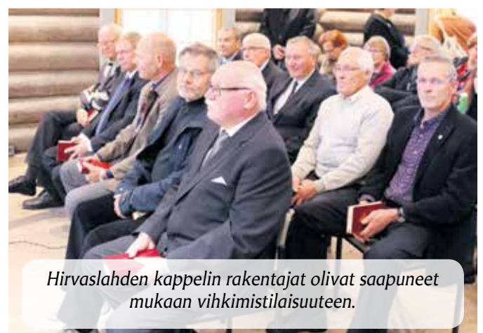
Hirvaslahden kappelin rakentajat olivat saapuneet mukaan vihkimistilaisuuteen.