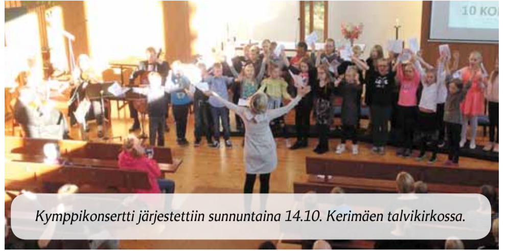
Kymppikonsertti järjestettiin sunnuntaina 14.10. Kerimäen talvikirkossa.

pentui 14.10. pidettyyn Kymppikonserttiin. Kuulijoita saapui lähes 130 ja konsertin jälkeen herkuteltiin - syntäreillä kun kerran oltiin. Lämmin kiitos upeille nuorille laulajille ja vielä kerran onnea kymmenen syntymäpäivän johdosta!