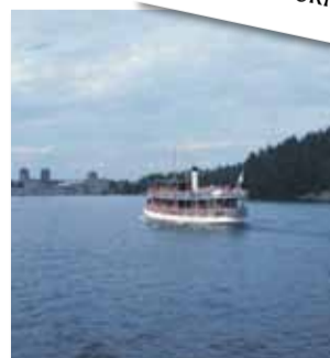
Savonlinnan kesässä on helppo viihtyä