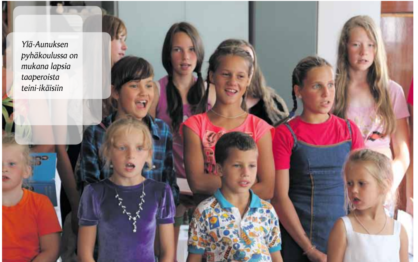
Ylä-Aunuksen pyhäkoulussa on mukana lapsia taaperoista teini-ikäisiin

Osa nykyisistä pyhäkoululaisista on jo nuoruuden kynnyksellä. Heidän joukostaan jälleen kolme nuorta pääsevät toteuttamaan ammattihaaveensa seurakuntamme stipendiaatteina. ■