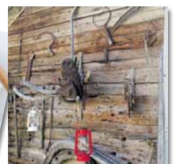
Papin työ vei mielenkiintoisiin paikkoihin