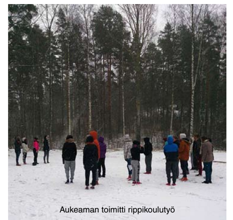
Aukeaman toimitti rippikoulu