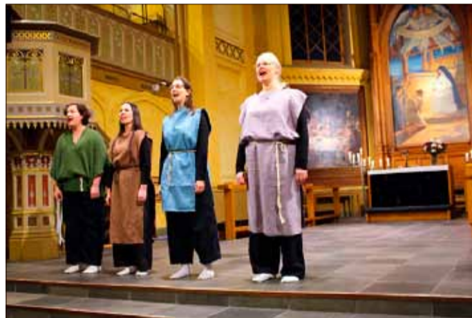
Puvustuksessa yhdistyy itä ja länsi: valkoiset tabi-sukat ja mustat hakamat ovat Japanista, tunikat ja huivit taas kirkkodraaman ja keskiaikaisen pukeutumisen koodistosta.