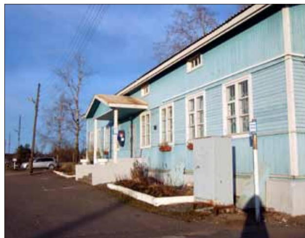
Elisenvaaran asema vuonna 2014.

Joukkojen liikkuminen havaittiin myös vihollisjoukoiksi ja Neuvostoliitto ryhtyi suunnittelemaan rautatiease-