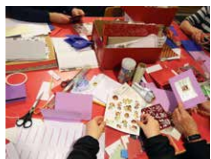
Askartelukerho on aloittanut taas Tuomiokirkko-seurakunnassa. Seuraavan kerran askarrellaan pe 2.12. klo 13 Säämingin srk-talolla.