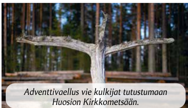
Adventtivaellus vie kulkijat tutustumaan Huosion Kirkkometsään.