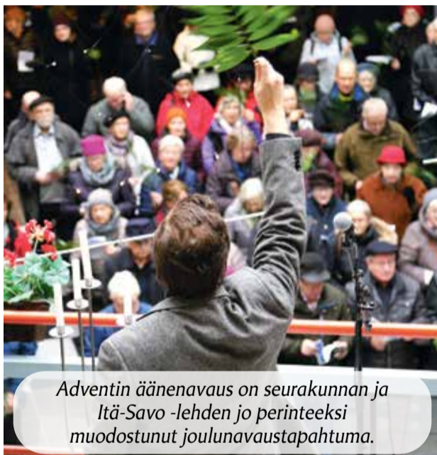
Adventin äänenavaus on seurakunnan ja Itä-Savo -lehden jo perinteeksi muodostunut joulunavaustapahtuma.

Saapumisohje ja lisätietoa Huosiosta: savonlinnaseurakunta.fi/huosio