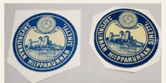
Savonlinnan hiippakunnan sinetti.