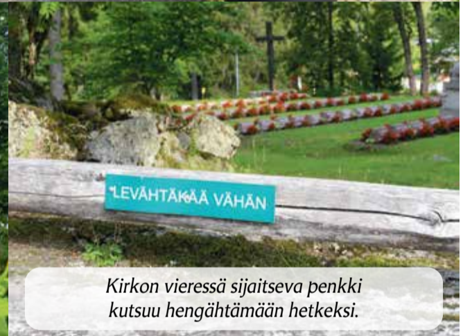
Kirkon vieressä sijaitseva penkki kutsuu hengähtämään hetkeksi.