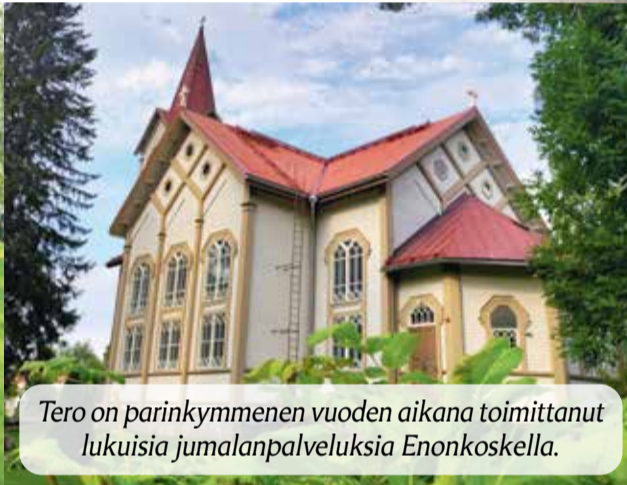
Tero on parinkymmenen vuoden aikana toimittanut lukuisia jumalanpalveluksia Enonkoskella.