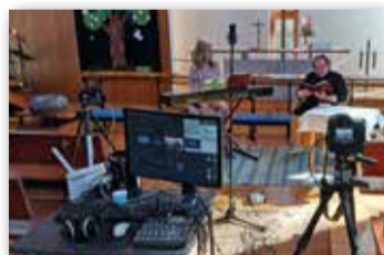
Äitienpäivän perhemessu striimattiin Kerimäen kappeliseurakunnan Facebook-sivulle.