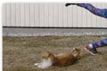
Nuorisotyön jumppavideolla esiintyi myös jumppaamisesta kieltäytynyt kissa.