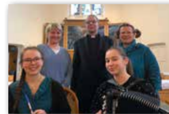
Tuomiokirkon ja Rantasalmen kirkon iltahartauksia kuunneltiin sekä suorina lähetyksinä että nauhoituksina.