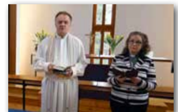
Hoivakotien ja palvelutalojen asukkailla lähetettiin videotervehdyksiä.