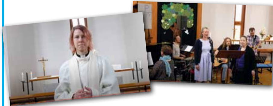
Isosten siunaamisjumalanpalvelus toteutettiin videoituna. Video löytyy seurakunnan YouTube-kanavalta.

"Aika jännät fiilikset, mutta ootan hyvillä mielin että pääsee leirille." "Odotan innolla. Kesällä ei muuta järkevää pääse tekemään kun kaikki on peruttu." "Jännittää kun on ekaa kesää isosena ja heti tämmöset erityisjärjestelyt." "Tulee kaikkien aikojen leiriksesä, metrin etäisyyksillä." "Tätä voi sitten vanhana muistella kiikkustuolissa." "Mietityttää miten pääsee antamaan yhtä hyvän leirikokemuksen leiriläisille ku aikasempina vuosina."