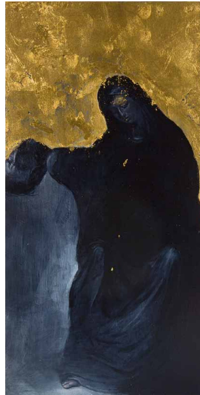
Pieta from series Hidden revelations 2016