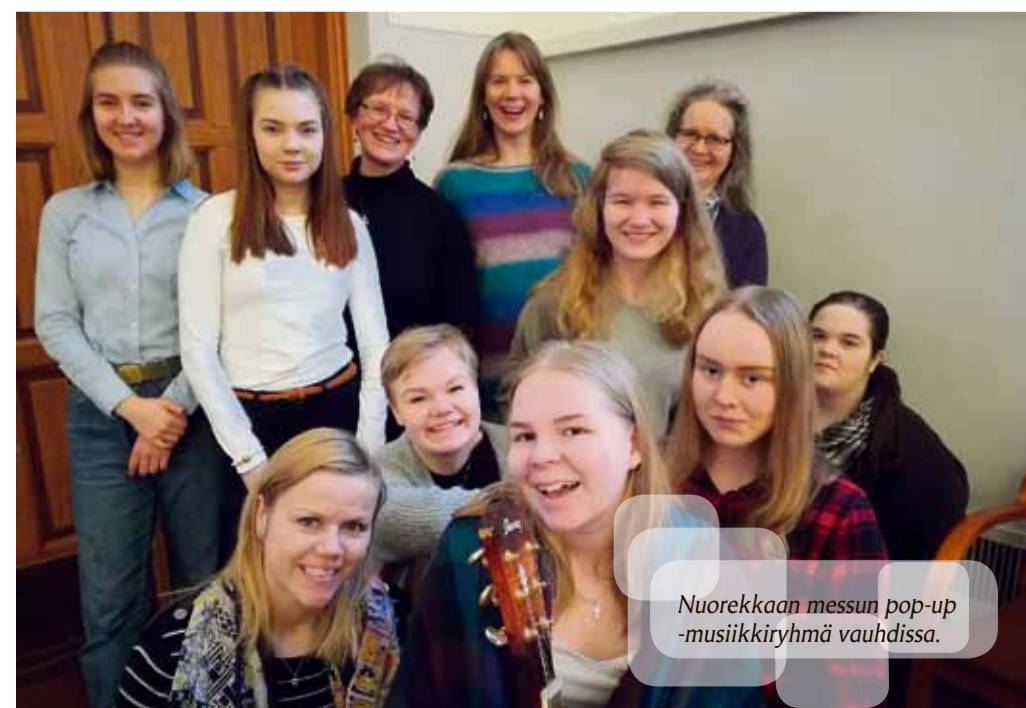
Nuorekkaan messun pop-up -musiikkiryhmä vauhdissa.